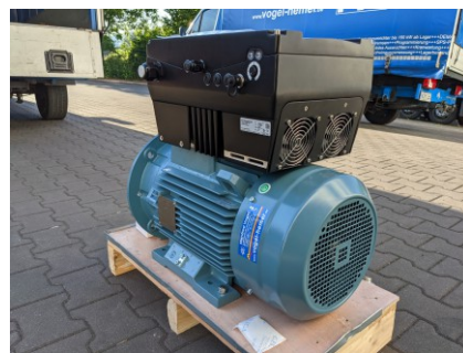
ABB-Motor mit aufgebautem KOSTAL-Umrichter

4 Wir haben unseren Lagerbestand an Drehstrom-Motoren durch ABB-Motore erweitert. Trotz der räumlichen Nähe zum Europa-