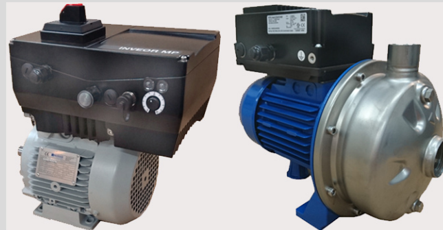
li.: Hocheffizienter Synchronmotor mit direkt angebautem FU zum Kupplungsbetrieb an einer Pumpe. re.: Kreiselpumpe mit FU